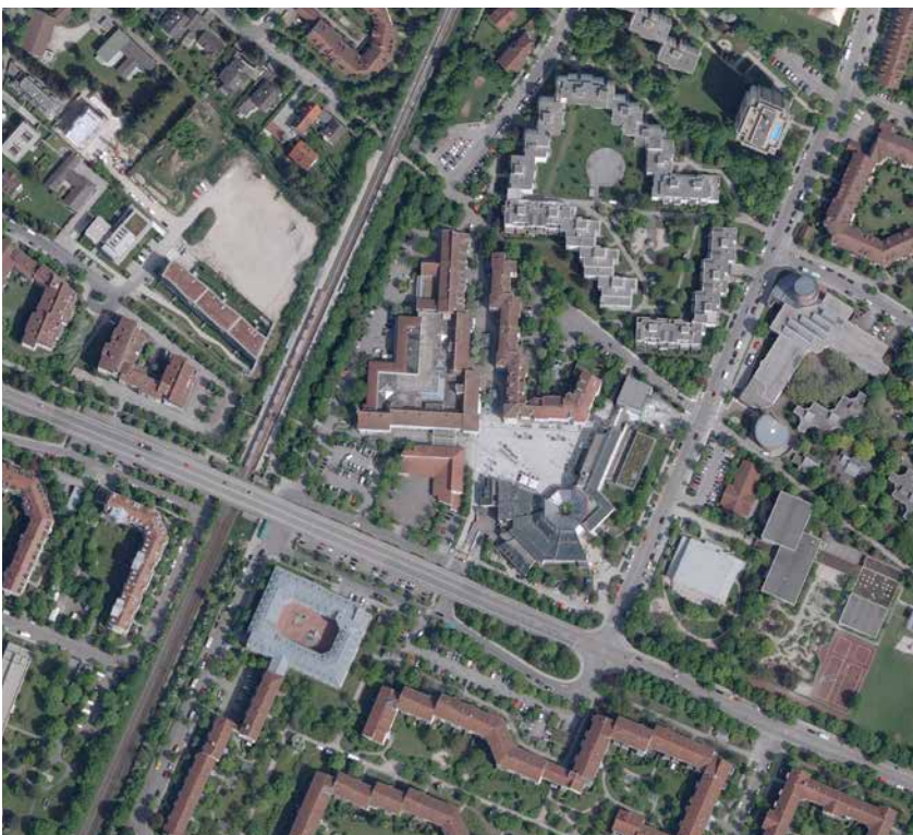
Luftbild Bearbeitungsgebiet Rathausplatz

Bearbeitungszeitraum: Auslobung November 2018 Preisgerichtssitzung März 2019 Anzahl Teilnehmer: 9 Fläche: ca. 1,5 ha