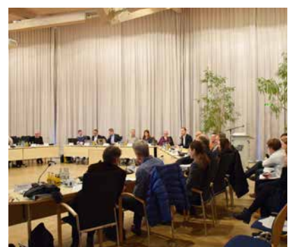
Rückfragekolloquium am 19.12.2018