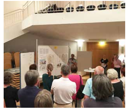
Bürgerbeteiligung am 28.06.2019